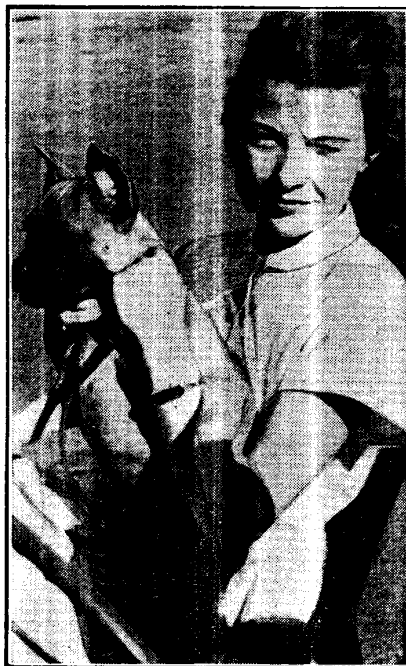
... den man hinter den Kiemen kitzelt Dreijährige Ehe: Gattin Mamaine

Er hat sich nunmehr in England niedergelassen, dem merkwürdigen Lande, das es fertig bringt, sich von Europa abzusondern und doch mit Haut und Haar dazugehören. Dort könnten die zwei Hälften jenes Pfeils, der, ins Blaue geschossen, sich teilt, wieder zusammenfinden, das heißt: dort könnte sich die — nach Koestler — verlorene Einheit aus Kontemplation und Tat wiederherstellen.